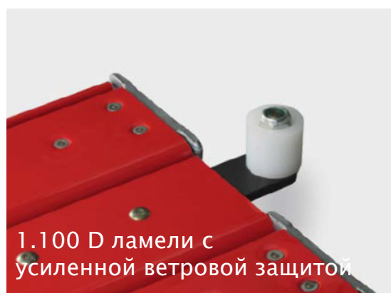
1.100 D ламели с усиленной ветровой защитой