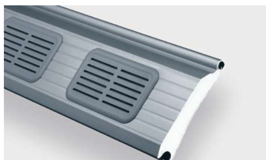
1.95 R вентиляционная решетка