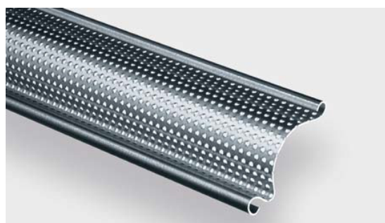
1.144L перфорированный проф.