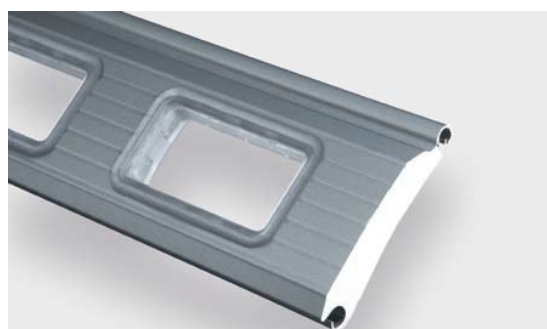
1.95 R оконный профиль