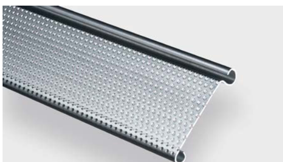
1.155L перфорированный проф.

С целью повышения уровня безопасности в зоне погрузки, улучшения обзорности и вентиляции, в профили можно встроить проемы и прорези.