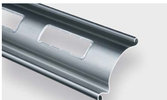
1.1620 оконный профиль