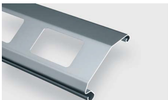
1.1590 профиль с решеткой