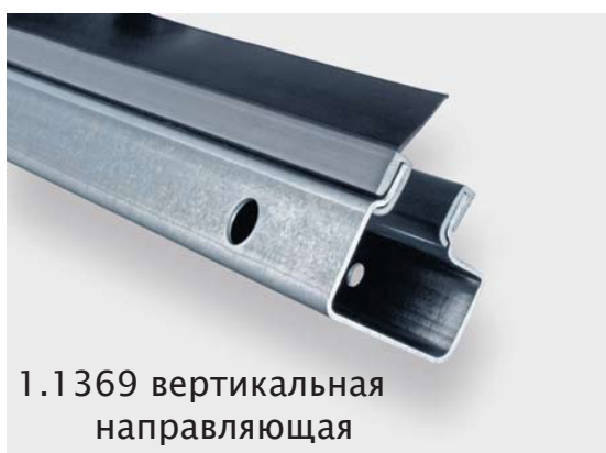
1.1369 вертикальная направляющая