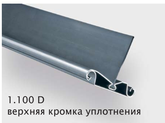
1.100 D верхняя кромка уплотнения